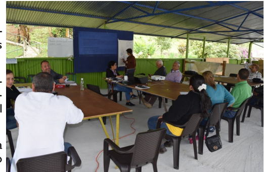
Participantes del curso de cooperativismo en Córdoba