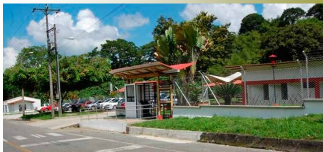
Entrada al Centro Nacional para el estudio del bambú guadua

Ubicación: Km 22 Vía Armenia-Córdoba, Quindío