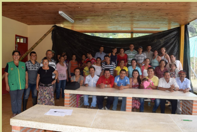
Grupo beneficiario de mejoramiento de vivienda córdoba

El Servicio Nacional de Aprendizaje SENA, tendrá como misión; la capacitación de la comunidad beneficiada en los procesos constructivos, el aprovechamiento adecuado de los bosques y la certificación de competencias laborales. Con ello; permitirá, no sólo mejorar las condiciones estructurales de sus viviendas sino también el de extender su conocimiento para mejorar la infraestructura de sus unidades productivas, fortalecer la asociatividad y la comunidad en el territorio.