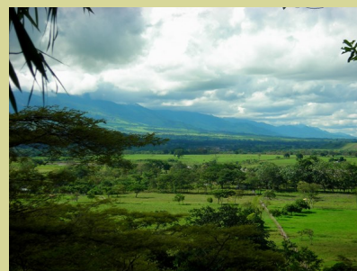
Foto panorámica de los llanos

Resultado de éstos primeros acercamientos, se tiene planeado realizar un seminario-taller de sensibilización sobre Guadua en el mes de septiembre, así como orientar programas de formación complementaria con el apoyo del Centro Agroindustrial del Meta-Villavicencio