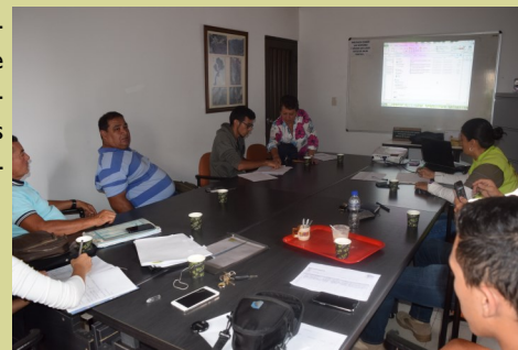
Primera reunión con ASOCOQUADUA, CRQ y la Mesa

Con el proyecto, se pretende realizar la recuperación paulatina de las 85 franjas verdes identificadas en el municipio de Armenia, por ahora, se inicia con la franja ubicada en el barrio Mercedes del Norte, para posteriormente presentar los resultados del proyecto al Ministerio de Agricultura y Ministerio de Medio Ambiente y posibilitar la inversión de recursos.