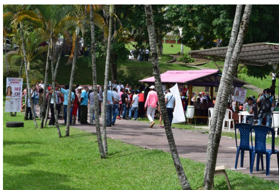
Fotos del día regional del Guaduoero