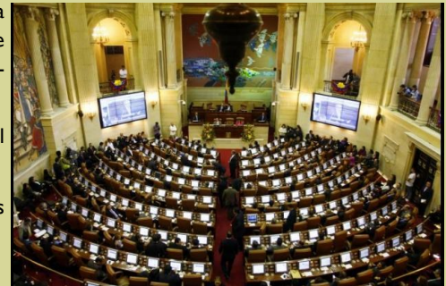
Congreso de la república