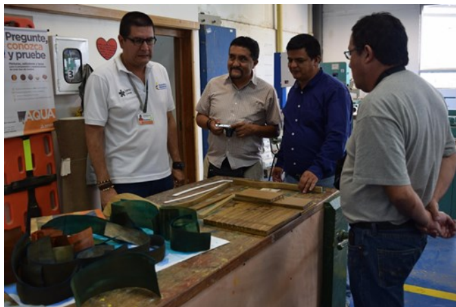
Tres profesores de la Univesridad Central del Ecuador con un instructor de guadua del SENA

El anterior proceso en Colombia, no se ha podido iniciar, pues la mayoría de proyectos de viviendas urbanas en el territorio nacional se han desarrollado en sistemas tradicionales, por lo cual se estableció el compromiso de realizar un intercambio de conocimientos sobre el tema.